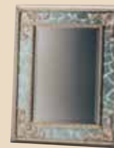
624 Specchiera / mirror l. 90 p. 5 h. 90 10 Kg / 0,05 m 3