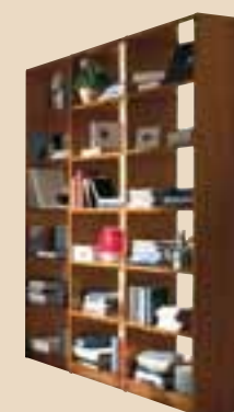
648 Soggiorno bifacciale living room element l. 200 p. 36 h. 220 115 Kg / 1 m 3