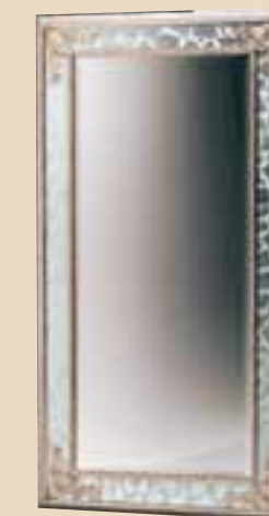
634 Specchiera / mirror l. 90 p. 5 h. 190 30 Kg / 0,1 m 3