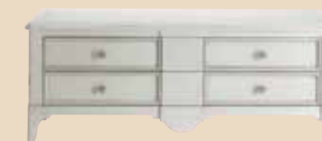
677 Base porta TV con cassetti TV element whit drawers l. 137 p. 55 h. 55 50 Kg / 0,45 m 3