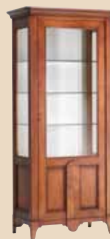
617 Vetrina 1 anta dx 1 door cabinet l. 90 p. 50 h. 202 50 Kg / 0,9 m 3