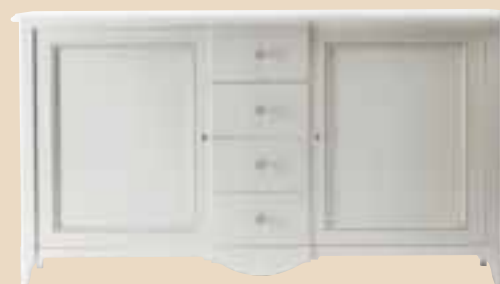
652 Credenza 2 ante 4 cassetti sideboard with 2 doors 4 drawers l. 205 p. 55 h. 114 85 Kg / 1,30 m 3