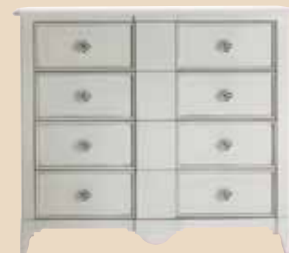
671 Comò 4 cassetti 4 drawers chest l. 130 p. 55 h. 114 65 Kg / 0,85 m 3