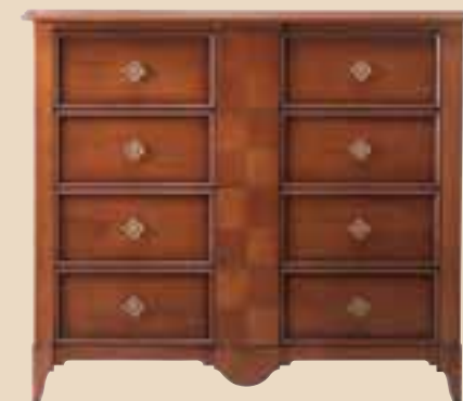
621 Comò 4 cassetti 4 drawers chest l. 130 p. 55 h. 114 65 Kg / 0,85 m 3