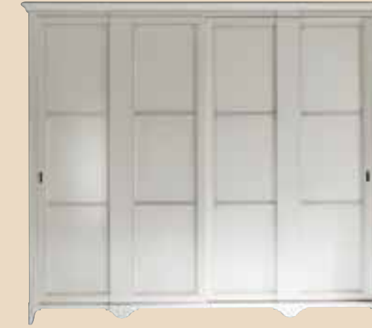
676 Armadio 2 ante scorrevoli wardrobe whit 2 sliding doors l. 290 p. 70 h. 250 155 Kg / 1,40 m 3