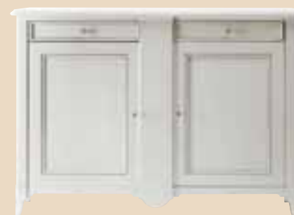
657 Credenza 2 ante sideboard whit 2 doors l. 160 p. 55 h. 114 65 Kg / 1 m 3