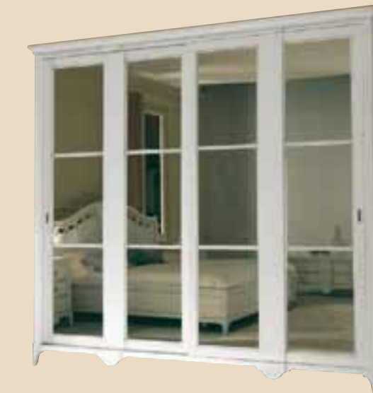
686 Armadio 2 ante scorrevoli con specchi wardrobe whit 2 sliding doors and mirrors l. 290 p. 70 h. 250 160 Kg / 1,40 m 3