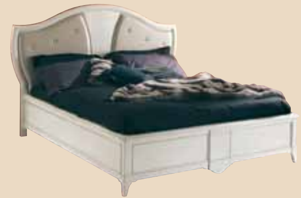
680 Letto matrimoniale con testata in pelle double bed with leather headboard l. 194 p. 212 h. 132 misura interna inside measurement 162x202 55 Kg / 1 m 3