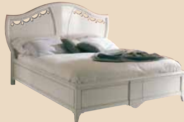
670 Letto matrimoniale double bed l. 194 p. 212 h. 132 misura interna inside measurement 162x202 55 Kg / 1 m 3