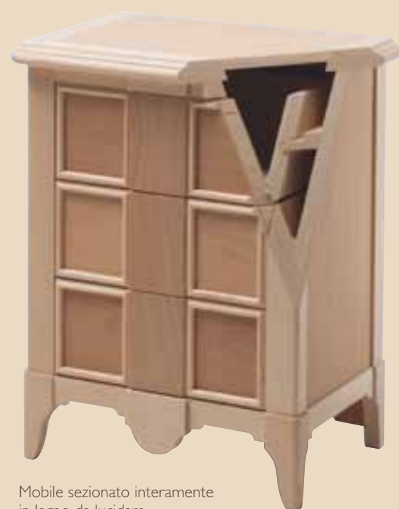
Mobile sezionato interamente in legno da lucidare. All wood sectioned furniture, to be polished.