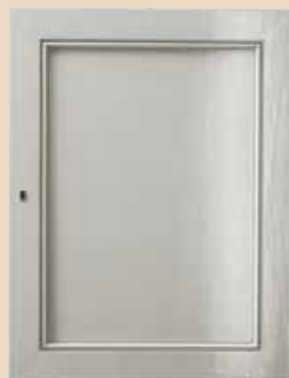
Laccato bianco. White lacquer.