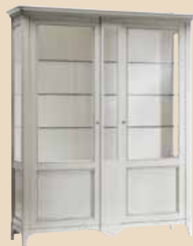
651 Argentiera 2 ante battenti silverware cabinet two leaf doors l. 182 p. 50 h. 220 90 Kg / 2 m 3