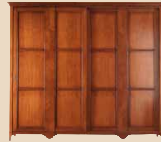
626 Armadio 2 ante scorrevoli wardrobe whit 2 sliding doors l. 290 p. 70 h. 250 155 Kg / 1,40 m 3