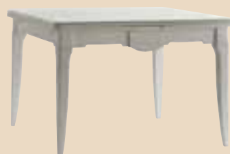
603 Tavolo quadrato allungabile square extending table l. 115 (aperto 50+50) p. 115 h. 79 55 Kg / 0,9 m 3