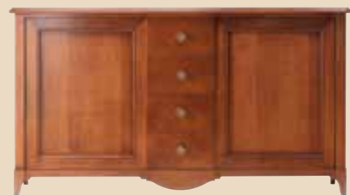
602 Credenza 2 ante 4 cassetti sideboard with 2 doors 4 drawers l. 205 p. 55 h. 114 85 Kg / 1,30 m 3