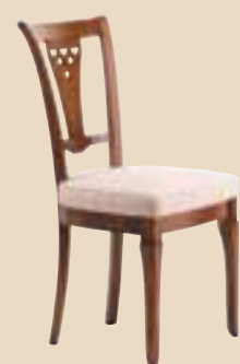
609 Sedia / chair l. 49 p. 53 h. 97 7 Kg / 0,25 m 3