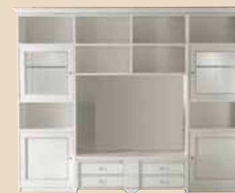
695 Soggiorno living room element l. 275 p. 55/42 h. 230 180 Kg / 1,30 m 3