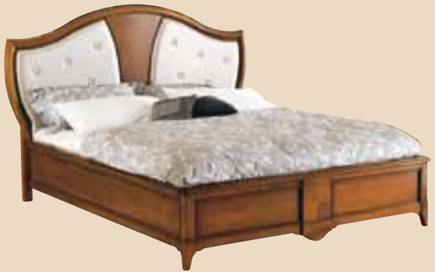
630 Letto matrimoniale con testata in pelle double bed with leather headboard l. 194 p. 212 h. 132 misura interna inside measurement 162x202 55 Kg / 1 m 3