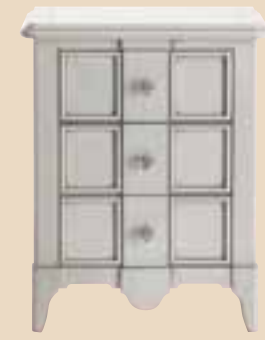
672 Comodino 3 cassetti 3 drawers bedside cabinet l. 56 p. 37 h. 70 15 Kg / 0,15 m 3