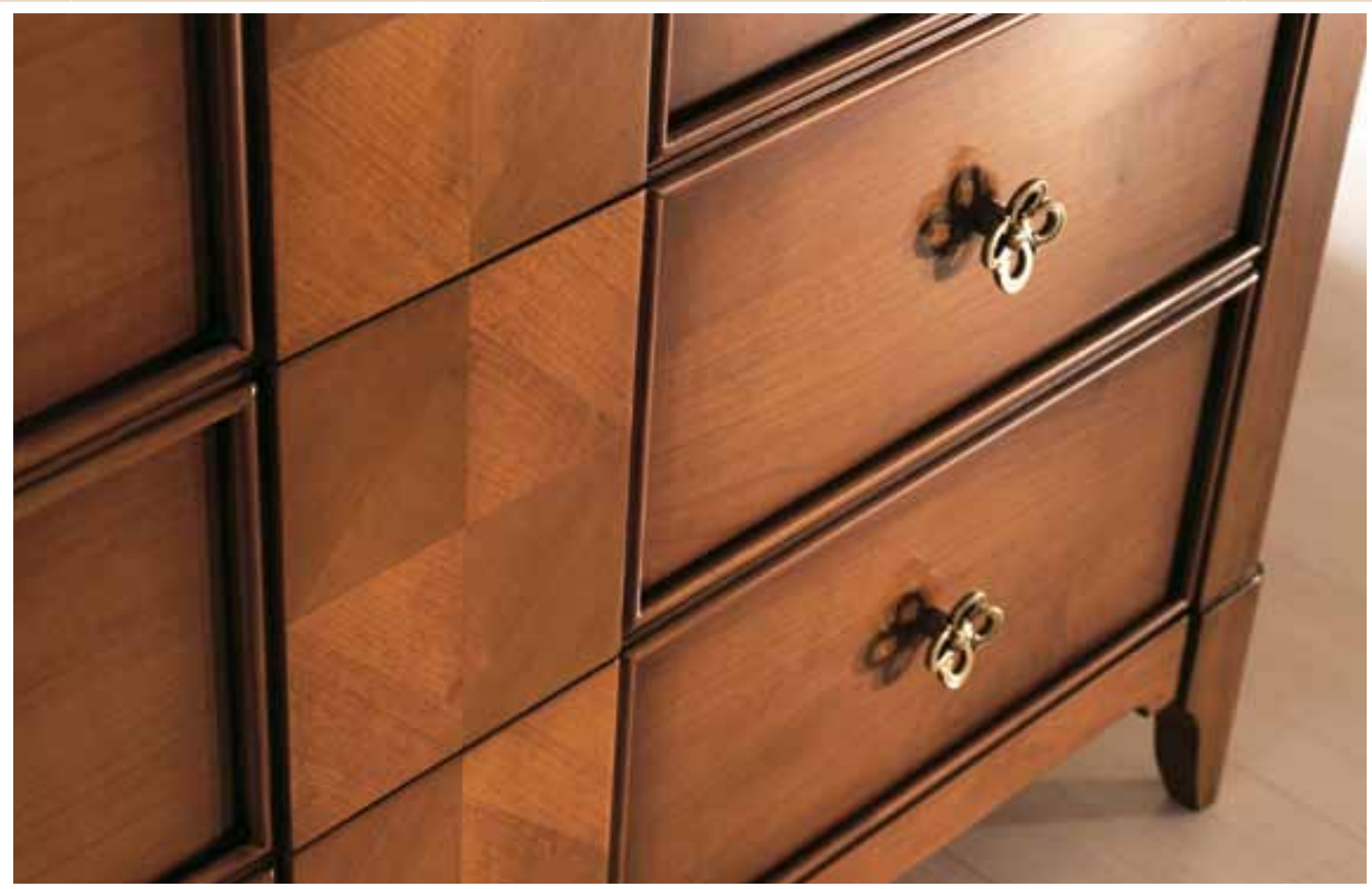
621 Comò 4 cassetti / 4 drawers chest l.130 p.55 h.114