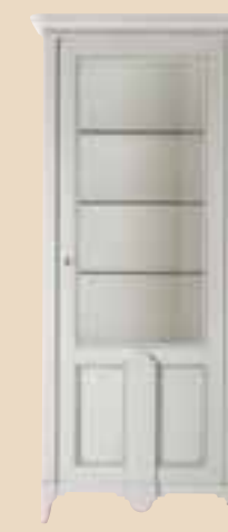
667 Vetrina 1 anta dx 1 door cabinet l. 90 p. 50 h. 202 50 Kg / 0,9 m 3