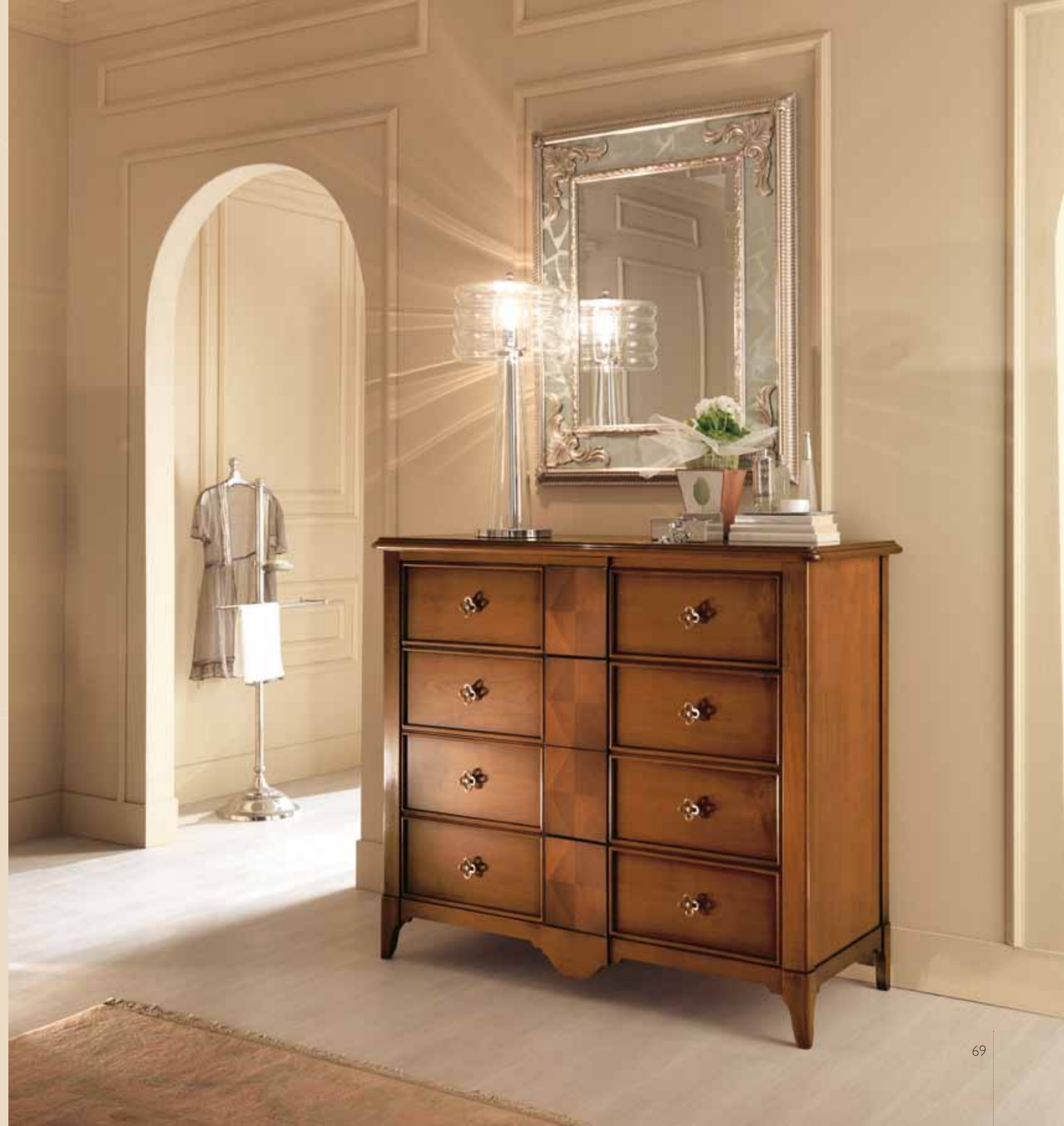
624 Specchiera / mirror l.90 p.5 h.90