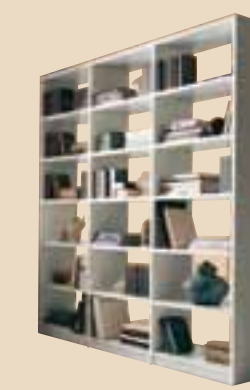
698 Soggiorno bifacciale living room element l. 200 p. 36 h. 220 115 Kg / 1 m 3