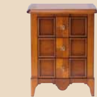
622 Comodino 3 cassetti 3 drawers bedside cabinet l. 56 p. 37 h. 70 15 Kg / 0,15 m 3