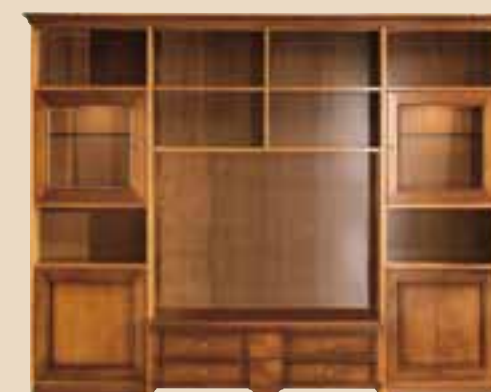
645 Soggiorno living room element l. 275 p. 55/42 h. 230 180 Kg / 1,30 m 3