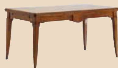
605 Tavolo rettangolare rectangular extending table l. 160 (aperto 50+50) p. 90 h. 79 75 Kg / 0,9 m 3