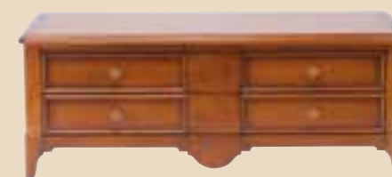
627 Base porta TV con cassetti TV element whit drawers l. 137 p. 55 h. 55 50 Kg / 0,45 m 3