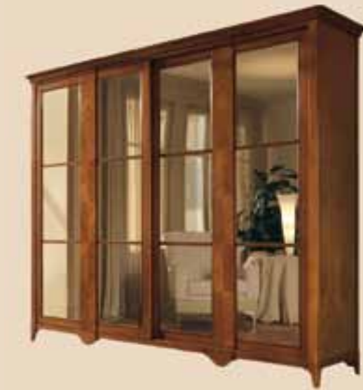
636 Armadio 2 ante scorrevoli con specchi wardrobe whit 2 sliding doors and mirrors l. 290 p. 70 h. 250 160 Kg / 1,40 m 3