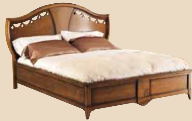
620 Letto matrimoniale double bed l. 194 p. 212 h. 132 misura interna inside measurement 162x202 55 Kg / 1 m 3