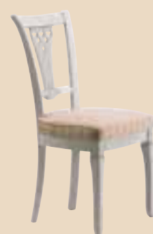
659 Sedia / chair l. 49 p. 53 h. 97 7 Kg / 0,25 m 3