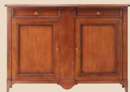
607 Credenza 2 ante sideboard whit 2 doors l. 160 p. 55 h. 114 65 Kg / 1 m 3