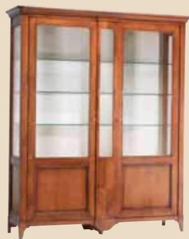
601 Argentiera 2 ante battenti silverware cabinet two leaf doors l. 182 p. 50 h. 220 90 Kg / 2 m 3